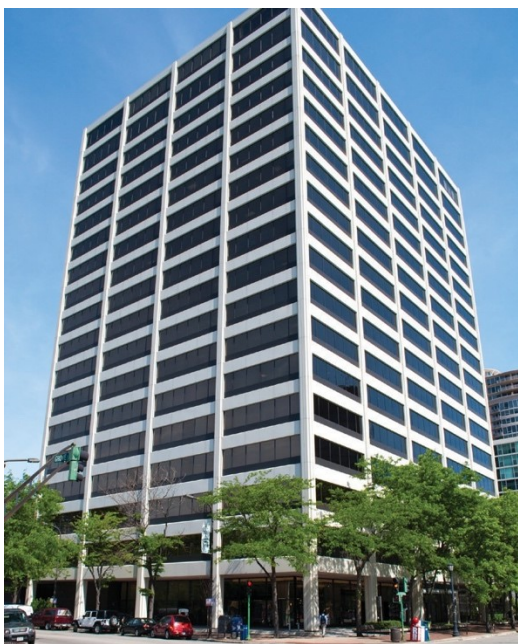
Budova One Rotary Center v Evanstonu, stát Illinois, USA

Rotary International je spravováno sekretariátem, který je veden generálním sekretářem a má téměř 800 zaměstnanců věnujících se podpoře klubů a distriktů na celosvětové úrovni. Světové ústředí Rotary sídlí v Evanstonu, Illinois, USA, v budově zvané One Rotary Center. V ní je k dispozici auditorium pro 190 sedících a přístup k archivu Rotary. Celé jedno křídlo budovy užívá exekutiva RI. Jsou tam konferenční místnosti sloužící členům Rady ředitelů RI a členům Správní rady Nadace Rotary a také kanceláře Prezidenta RI a dalších vyšších funkcionářů.