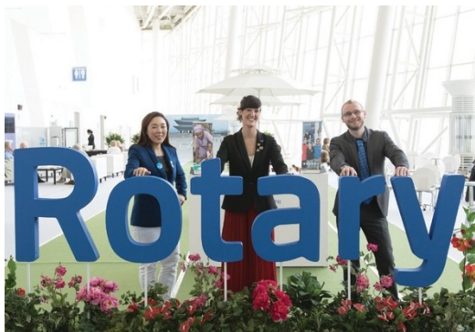
Účastníci kongresu Rotary International roku 2016 konaného v Koreji