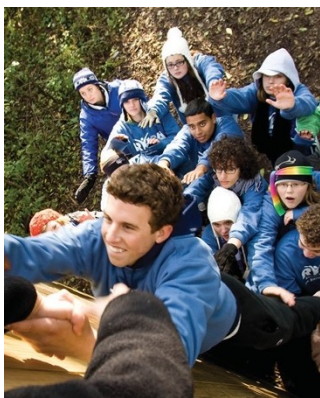
Semináře RYLA učí hodnotám služby a pěstují schopnosti vést ostatní již od raného věku

Interact a Rotaract kluby jsou podporovány Rotary kluby z blízkého okolí. Zeptejte se ve vašem klubu, jak se můžete zapojit, kdybyste chtěli pracovat s místním Interact nebo Rotaract klubem.