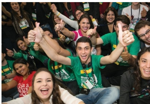
Členové Rotaractu se každý rok střetávají před Světovým shromážděním

Věříme tomu, že investicí do naší budoucnosti je posilování schopností mladých lidí vést jiné tým, že jim umožníme nabýt potřebných schopností a získávat zkušenosti napříč kulturami.