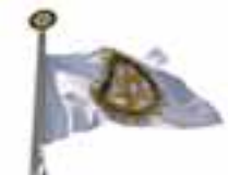
Obr. 1 Vlajka Rotary