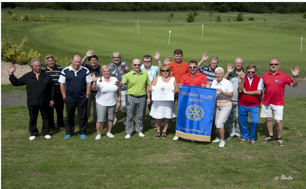
Golfový charitativní turnaj v Golf Resortu Bitoveves na podporu Dětského domova ve Vysoké peci