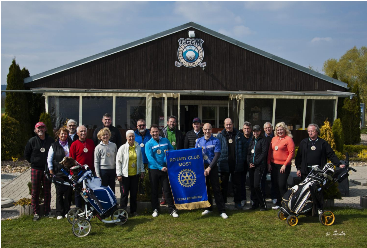
Zahajovací turnaj charitativních golfových turnajů 21. 4. 2017 v Mostě „ROTARY GOLF POMÁHÁ“