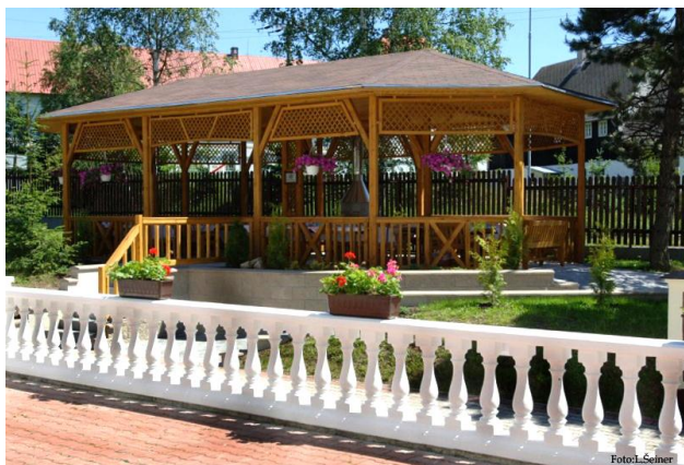
V Mostě - srpen 2005