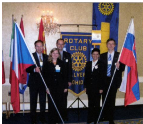
V Mostě – leden 2006

8. Výsledek projektu : Spokojený účastník GSE týmu a cenná klubová zkušenost s vysláním reprezentanta do USA.