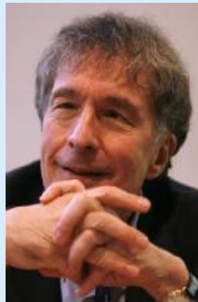
Howard Gardner Harvard Graduate School