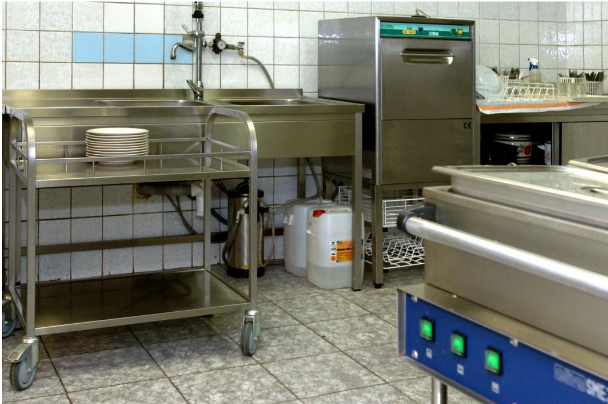
Personál DD v Mostě